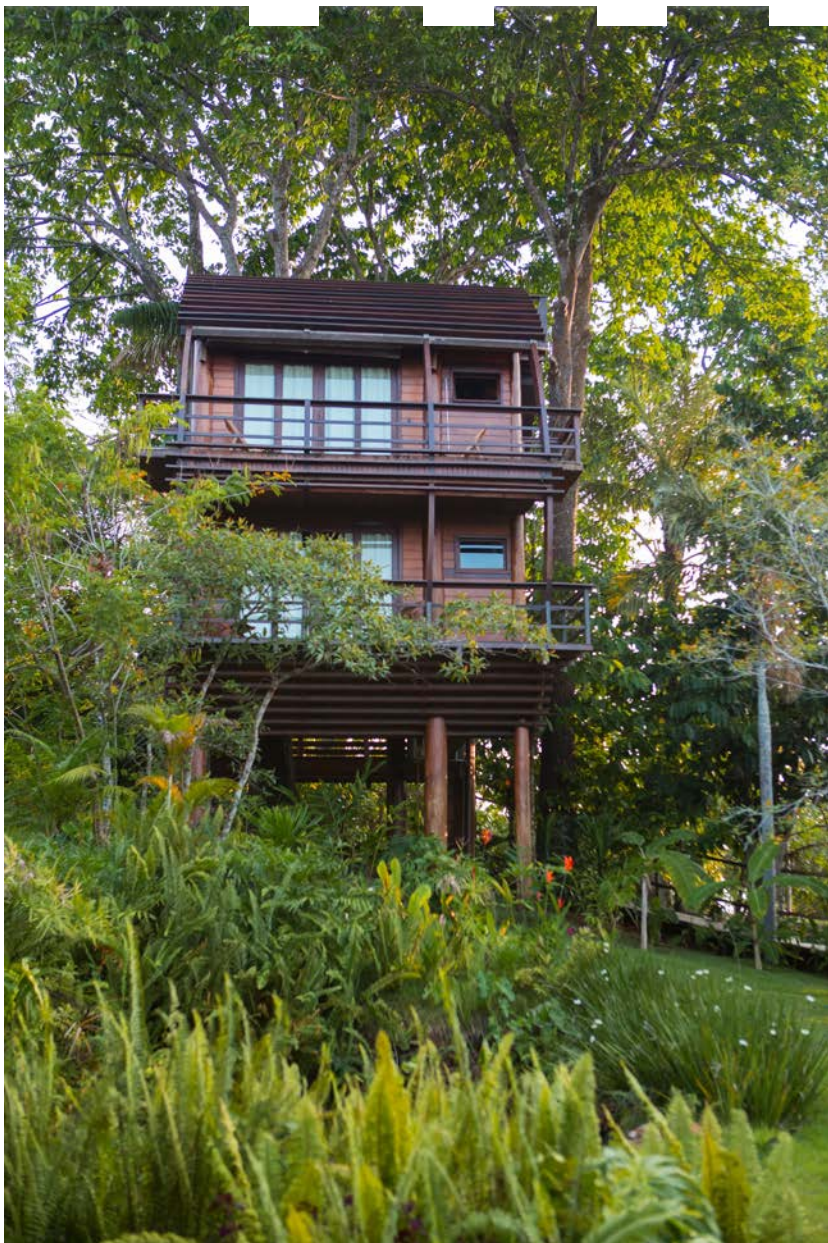
O Mirante do Gavião Lodge, no Rio Negro, Amazônia