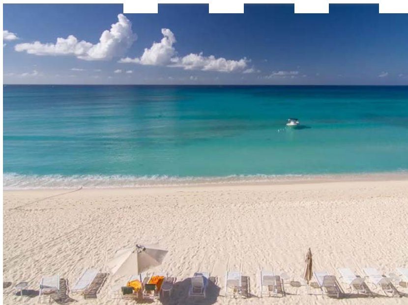
O hotel Grand Cayman, nas Ilhas Cayman, Caribe

O Kimpton Seafire Resort + Spa fica na ponta norte da Seven Mile Beach, praia de 11 quilômetros mais bem perfilada do balneário. A propriedade com 266 suítes é a primeira propriedade erguida ali depois de uma década, hiato que se deve às altas exigências no padrão hoteleiro das Ilhas Cayman .