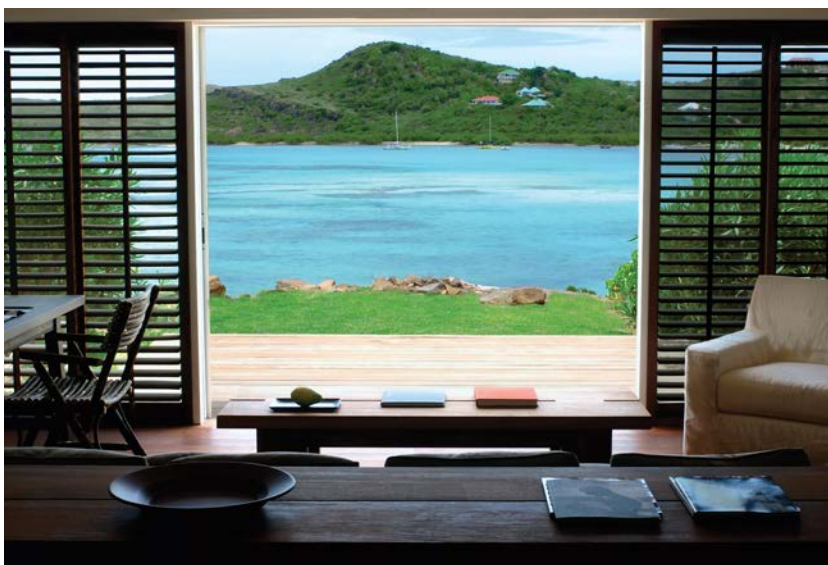
O hotel Le Sereno em St Barth

As 39 acomodações, agora mais amplas, têm novo design interior e são turbinadas em tecnologia: com painel para conexão de gadgets e música via Bluetooth. Ainda entre as novidades, o Le Sereno lança um restaurante pé-na-areia, uma boutique com curadoria de marcas francesas de forte presença em St. Barth e três novas acomodações Bungalow Piscine, que ganharam pé-direito de 3 metros, piso de pedras climatizadas e confortáveis sofás. Algumas das suítes têm jardim privativo e banheiras ao ar livre, além de piscinas privativas.