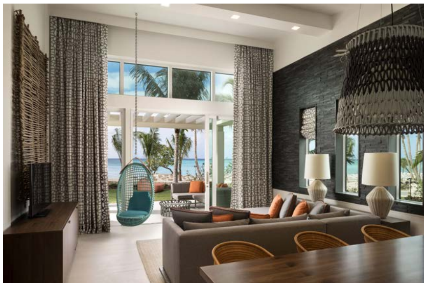
O hotel Grand Cayman, nas Ilhas Cayman, Caribe

O resort de praia tem décor contemporâneo, inspirado na flora do local, com tons de vermelho, pink e coral misturados a tecidos de linho branco. Madeira, vidro e plantas dão o tom do lobby aos quartos, onde reina a luz natural. As sacadas são posicionadas de tal forma que garantem total privacidade dos hóspedes e a melhor vista das águas azul turquesa. Ainda, três exclusivos bangalôs potencializam o luxo de hospedar-se a ouvindo o barulho do mar.