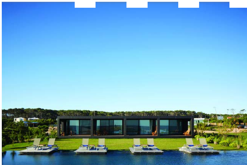
O hotel Bahia Vik, em José Ignácio, Uruguai