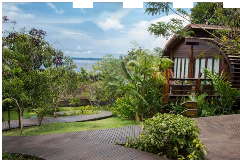
O Mirante do Gavião Lodge, no Rio Negro, Amazônia