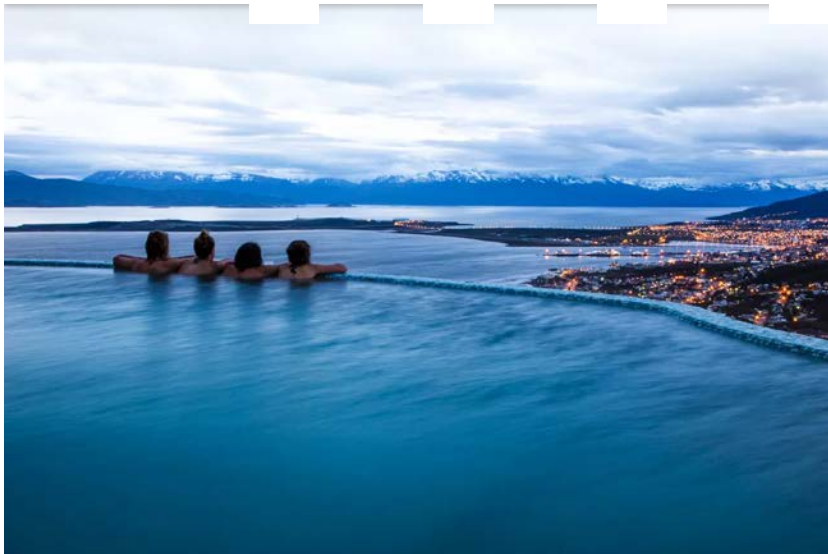
O Arakur Ushuaia Resort & Spa, no Ushuaia, Patagônia Argentina

Aberto em 2015, quando hospedou toda a equipe do filme O Regresso , incluindo Leonardo DiCaprio , o resort se tornou referência em hotelaria de luxo na Patagônia Argentina. A propriedade de 131 suítes está localizada no alto de uma colina na Reserva Natural Cerro Alarkén, com vista panorâmica para o Canal de Beagle e a cidade de Ushuaia, na mítica Tierra del Fuego. A apenas 20 minutos do aeroporto e a 12 minutos do centro da cidade – de onde partem os passeios de barco pelo Canal Beagle – o hotel está também próximo às principais atrações do destino, como o Parque Nacional Tierra del Fuego, os lagos Escondido e Fagnano e a estação de esqui Cerro Castor.