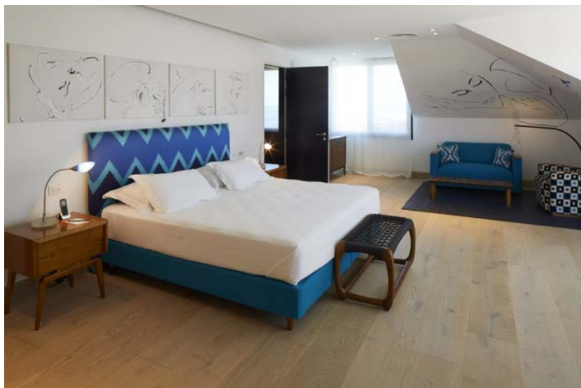
O hotel Bahia Vik, em José Ignácio, Uruguai