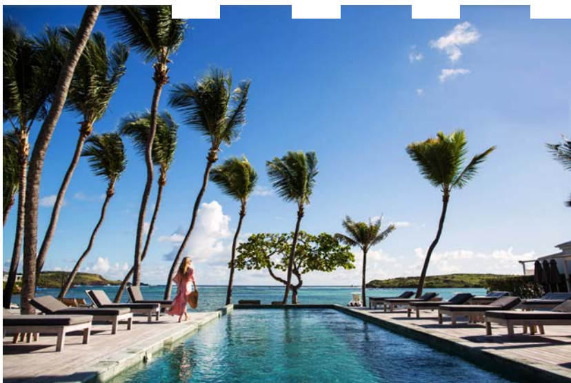
O hotel Le Sereno em St Barth

O hotel, na ilha caribenha com os beach clubs mais fervidos , fica à beira da piscina natural de Grand Cul-de-Sac, uma reserva marinha protegida por barreira de corais de águas rasas perfeitas para a prática de snorkel, vela, windsurfe e kitesurfe. Após ter sido destruído pelo furacão Irma em setembro de 2017, o hotel finalmente será reaberto no dia 1º de dezembro. Os estragos deram oportunidade para repaginar as áreas comuns, solário, jardins, restaurante, fitness center e o Spa – agora ampliado, ostentando três salas de tratamento, sendo uma delas à beira d’água.